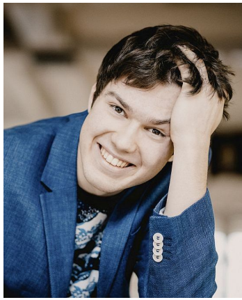
Musikakademie Liechtenstein. Mit 17 komponierte er die Sonate Leviathan op. 15.

Rezension "Viel Beifall in Olpe für jungen Künstler" WP 11. Oktober 2021